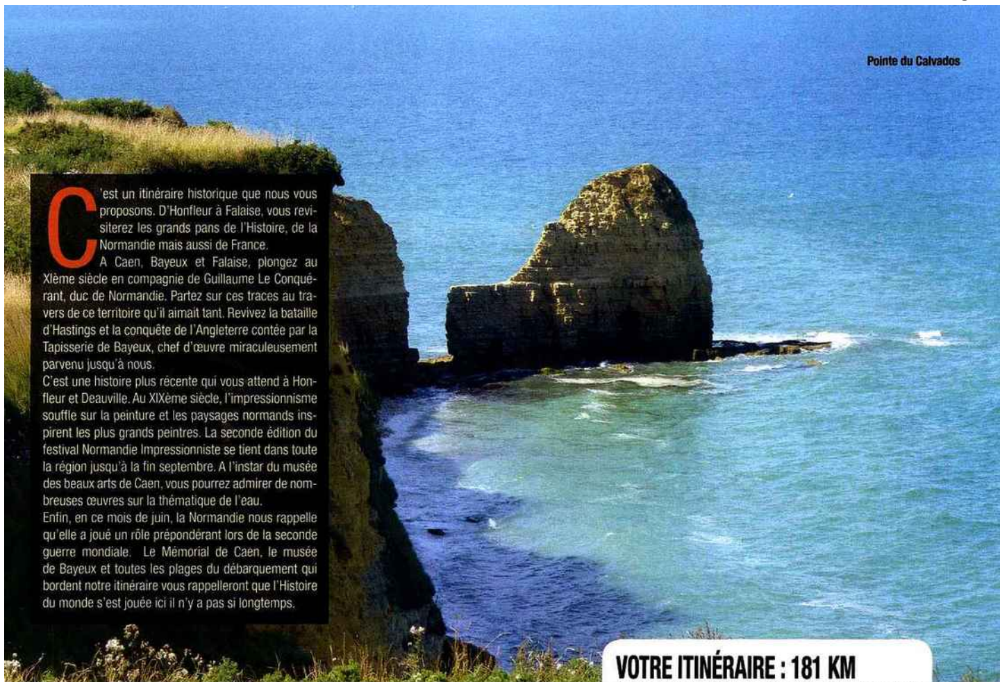
Pointe du Calvados

C 'est un itinéraire historique que nous vous proposons. D'Honfleur à Falaise, vous revisitez les grands pans de l'Histoire, de la Normandie mais aussi de France.